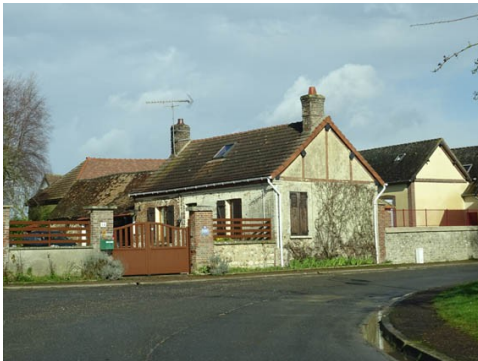
Le bourg de Tilly

Les avis seront cohérents avec ceux émis ces dernières années, à savoir : pas de maisons à volume compliqué (type V, W, Y, ou Z), pentes à 45° pour les volumes principaux, ardoise ou tuile plate de teinte brun vieilli, à 20u/m 2 , avec un débord de toiture de 20cm, enduit de teinte beige clair avec modénatures (au choix : chaînages, encadrement de fenêtres, soubassement, colombage...). *Voir les autres fiches.