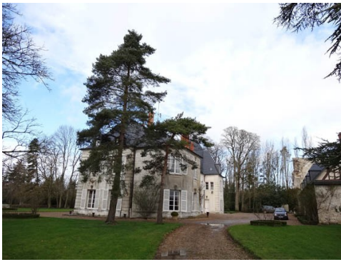
Vue éloignée du château