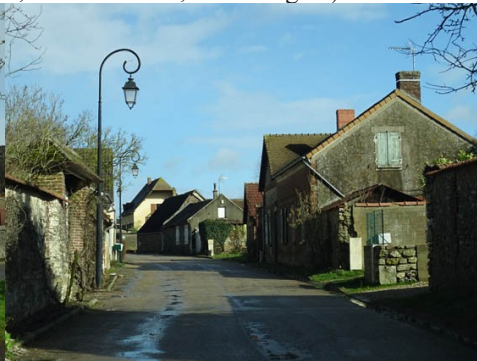
Le bourg de Tilly