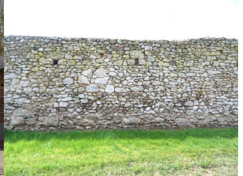
Le mur de clôture

Pour la zone en rose foncé dans le périmètre de 500m