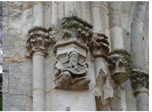
Détail du choeur