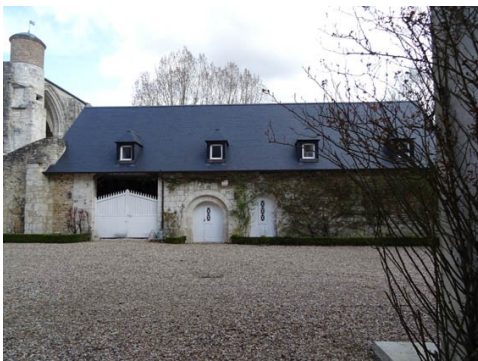
Le centre équestre