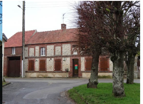
Le bourg de Tilly